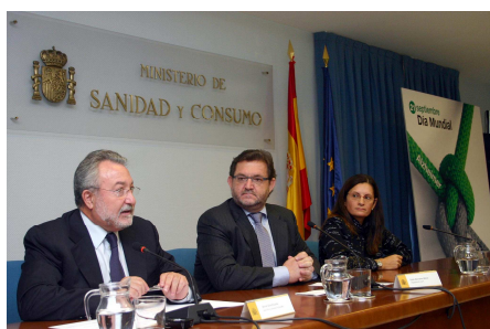
(Rueda de Prensa. Año 2008)

Se ha solicitado la asistencia e intervención de Dña. Trinidad Jiménez, Ministra de Sanidad y Política Social.